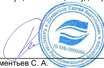
Дементьев С. А. Сертифицированный аудитор Республики Казахстан, квалификационное свидетельство аудитора № МФ-0000086 от 27 августа 2012 года